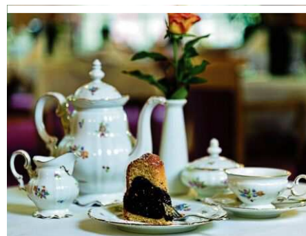
Köstlich: Hausgemachte Kuchen

Als neueste Weiterentwicklung gilt das Trainingstherapiezentrum. BewohnerInnen haben hier die Möglichkeit, an modernsten Geräten individuell auf sie abgestimmte Übungen durchzuführen. Zum Freizeitangebot gehören auch professionell geleitete Gruppenaktivitäten, abwechslungsreiche Ausflüge runden das Programm ab. So geht es gemeinsam etwa zu den Festspielen nach Reichenau, zum Heurigen, in die Kitenberger Erlebnisgärten oder in die Wachau.