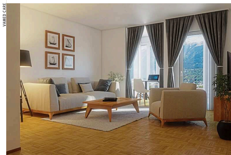
Gemütlich: VITALITY Residenz Veldidenapark Innsbruck

Urlaubsgefühl. Die VITALITY Residenz Veldidenapark in Innsbruck wartet mit einem atemberaubenden Blick auf die Tiroler Bergwelt auf