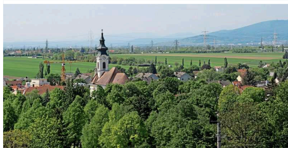
Oberlaa: nur 16 U-Bahn-Minuten trennen einen von der Wiener Innenstadt