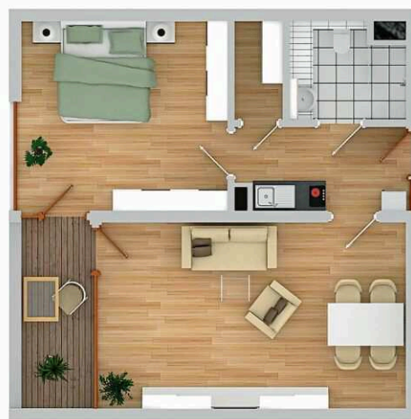
Wohnbeispiel VITALITY Residenz Am Kurpark Wien, Apartment B4/54 m 2

Insgesamt stehen in Wien 240 Ein- bis Dreizimmer-Apartments zwischen 32 und 89 m 2 und in Innsbruck 120 Apartments von 25 bis 110 m 2 zur Verfügung. Sie alle verfügen über einen Vorraum, einen großzügigen Wohn-Schlafrum, ein Küchenelement, ein Badezimmer mit WC, eine Loggia oder eine Terrasse (in Wien mit kleinem Gartenanteil, einem eigenen Kellerabteil und einer Box im Weinkeller). Jedes Apartment kann ganz nach eigenen Vorlieben eingerichtet werden.