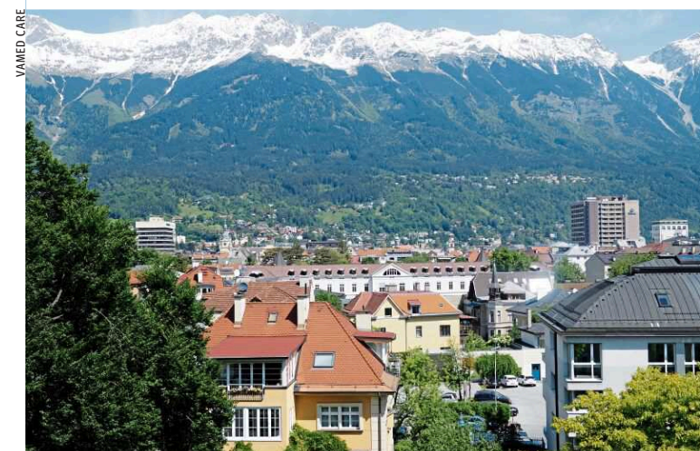
Innsbruck fasziniert durch seine einzigartige Lage

Dort zu leben, wo andere Menschen Urlaub machen – dieser Traum erfüllt sich in der VITALITY Residenz Veldidenapark Innsbruck. Der urbane Standort im Stadtteil Wilten ermöglicht es den BewohnerInnen auch ohne Auto am abwechslungsreichen Stadtleben teilzunehmen. Direkt in der Residenz stehen den BewohnerInnen eine Bibliothek, ein Café mit Sonnenterrasse, ein Clubzimmer, ein Restaurant, ein Weinstüberl, eine Kapelle und üppigen Parkanlagen ebenso zur Verfügung wie ein Friseur und Gesundheitseinrichtungen. Zum Freizeitangebot in der VITALITY Residenz Veldidenapark Innsbruck gehören ein Aktivprogramm mit Wanderungen, Literaturtreffen, Vernissagen, Sprachkurse, Sommer- und Herbstfeste