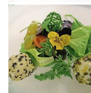
Gesund und abwechslungsreich

sowie Konzerte. Besonders beliebte Aktivitäten sind auch Ausflüge mit der Nordkettenbahn in den Naturpark Karwendel, dem größten Naturpark Österreichs. Weitblicke über die Stadt und eine hervorragende Küche findet man etwa im Restaurant Seegrube auf 1.905 m. Von dort startet auch der gut ausgebaute Panorama-Rundweg.