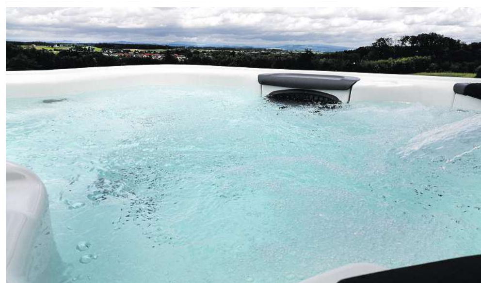
Villeroy & Boch Outdoor Whirlpools -entspannen auf höchstem Niveau

Doch oft ist es so, dass fix verbaute Massagedüsen nicht ideal für den Benutzer des Outdoor Whirlpools positioniert sind – und damit ihre Wirkung nicht zur Gänze ausspielen konnten. Das hat mit den neuen Modellen von Vil-