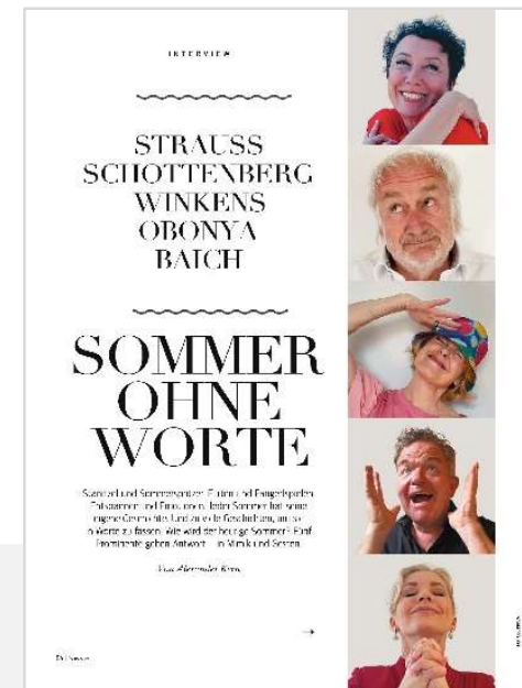
Storytelling: Short Piece